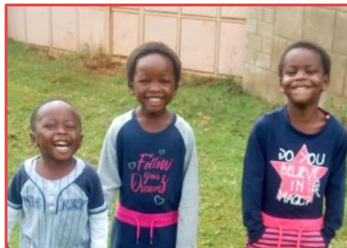
Jean geniet van haar nieuwe broertje en zusje.

Happy Rock Center PO Box 5105 30100 Eldoret Kenya